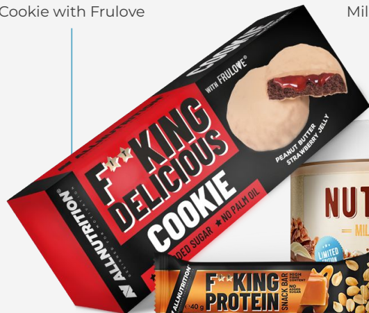
FITKING DELICIOUS Cookie with Frulove