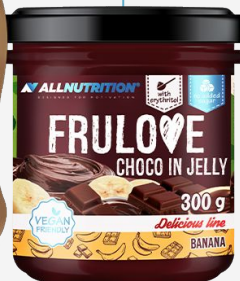
FRULOVE Choco in Jelly Banana