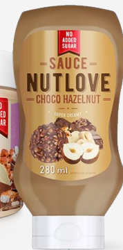
NUTLOVE Sauce Choco Hazelnut