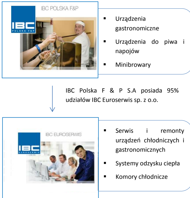
Tabela: Wykaz jednostek wchodzących w skład Grupy Kapitałowej IBC POLSKA F & P S.A.