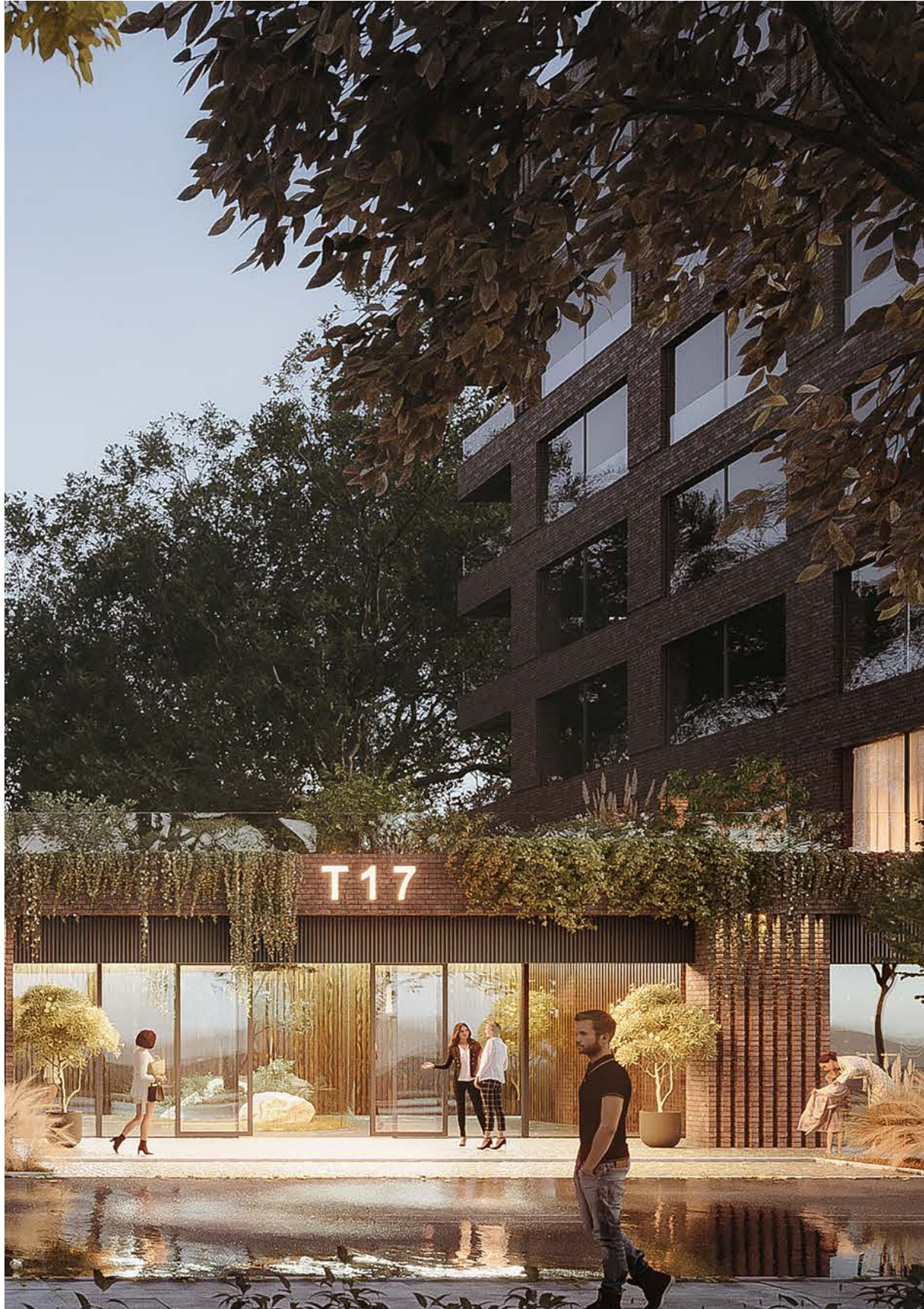
Wstępne wizualizacje projektu pod nazwą T17 w Łodzi