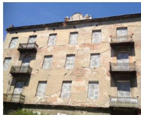
Warszawa, ul. Kamionkowska 41. Stan przed i po restrukturyzacji

Zgodnie z informacjami posiadanymi przez Emitenta, na dzień przekazania raportu akcjonariuszami posiadającymi co najmniej 5% głosów na walnym zgromadzeniu akcjonariuszy 2C Partners są następujące podmioty: