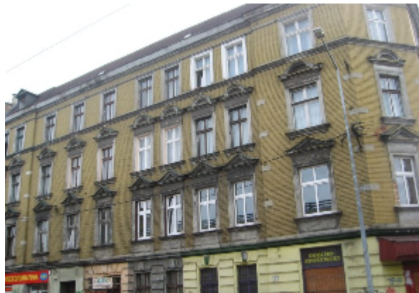
Gliwice, ul. Św. Katarzyny 1. Stan przed i po rewitalizacji