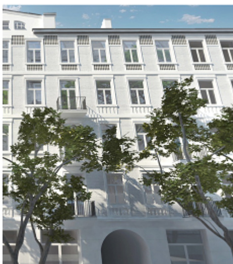
Warszawa, ul. Stalowa 41 - wizualizacja przykładowego wyglądu elewacji po remoncie

W IV kwartale 2018 r Spółka w dalszym ciągu prowadziła prace związane z przygotowaniem projektów przy ul. Stalowej 41 i Strzeleckiej 26. Kontynuowano procedurę związaną z uzyskaniem pozwolenia na budowę, prowadzono prace związane z odpowiednim zabezpieczeniem budynków, a także przygotowaniem procesu budowlanego. Spółka uzyskała 31.07.2018 roku decyzję o pozwoleniu na budowę na remont budynku przy ul. Strzeleckiej 26. Decyzja ta stała się ostateczna 11.09.2018. Spółka uzyskała 7.09.2018 decyzję o pozwoleniu na budowę na remont budynku przy ul. Stalowej 41. Decyzja ta stała się ostateczna 09.10.2018. Spółka rozpoczęła również przygotowania do procesu sprzedaży lokali w projekcie przy ul. Strzeleckiej 26. Spółka przygotowywała również projekty wykonawcze i dokumentację niezbędną do wyboru generalnego wykonawcy remontów.