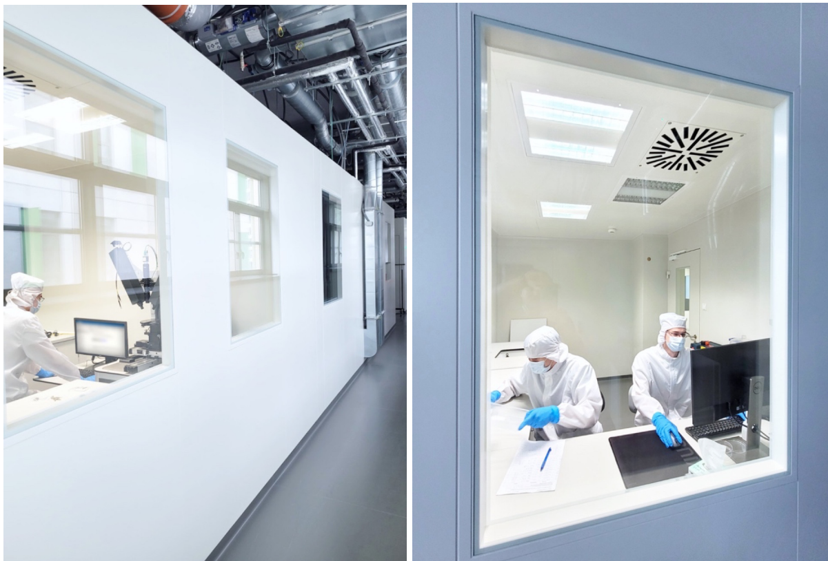
Fot: Pomieszczenia Clean Room w SDS Optic S.A.

Raport kwartalny SDS Optic S.A. za okres od 1 kwietnia 2022 r. do 30 czerwca 2022 r.