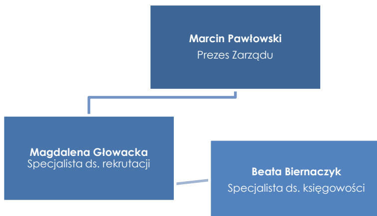
Wykres 1. Struktura organizacyjna w trzecim kwartale 2016 roku