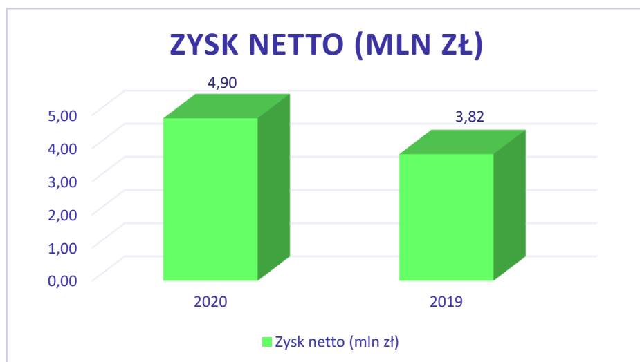
Wykres nr 2: Porównanie zysku netto Prymus S.A. w latach 2020 i 2019.