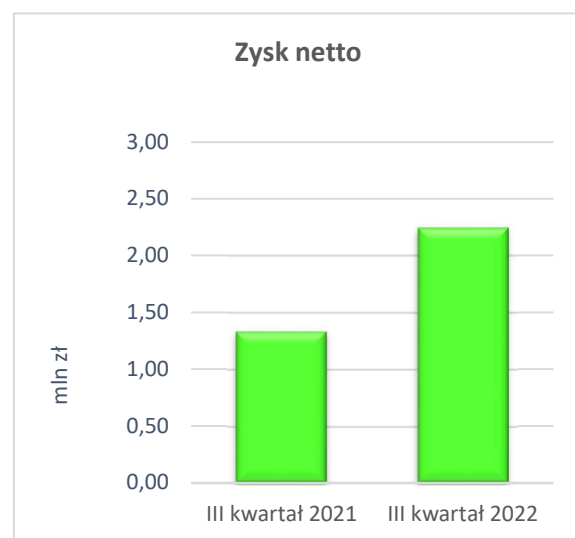
Rysunek nr 1. Porównanie kwartalnych danych finansowych III kwartał 2022 r. do III kwartał 2021 r.