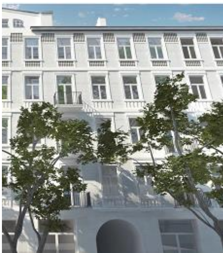
Warszawa, ul. Stalowa 41 - wizualizacja przykładowego wyglądu elewacji po remoncie

W III kwartale 2017 r Spółka w dalszym ciągu kontynuowała prace związane z pracami przygotowawczymi do rewitalizacji nieruchomości przy ul. Stalowej 41 i Strzeleckiej 26. Kontynuowano procedurę związaną z uzyskaniem pozwolenia na budowę, prowadzono prace związane z odpowiednim zabezpieczeniem budynków, a także podpisano kolejne umowy przedwstępne sprzedaży.