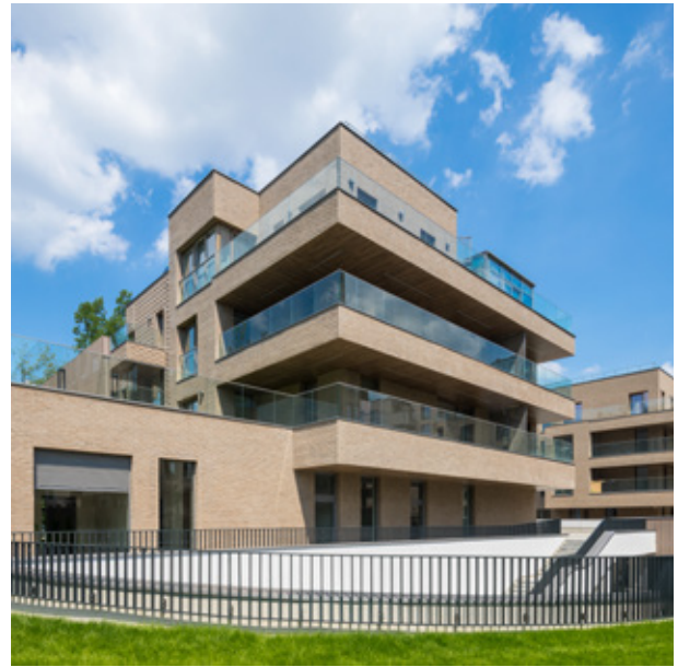
OSIEDLE: AWANGARDA (BEMOWO) 2018