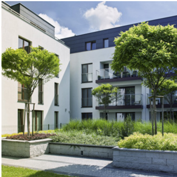
APARTAMENTY PŁOMYKA (WŁOCHY) 2013