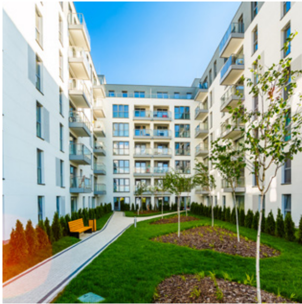
OSIEDLE: PRAHA I, II ETAP (PRAGA POŁUDNIE) 2017