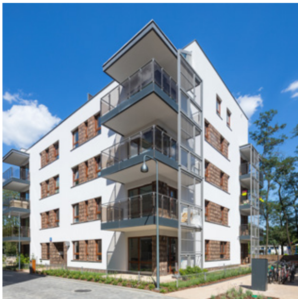
OSIEDLE: DEKADA (BEMOWO) 2018