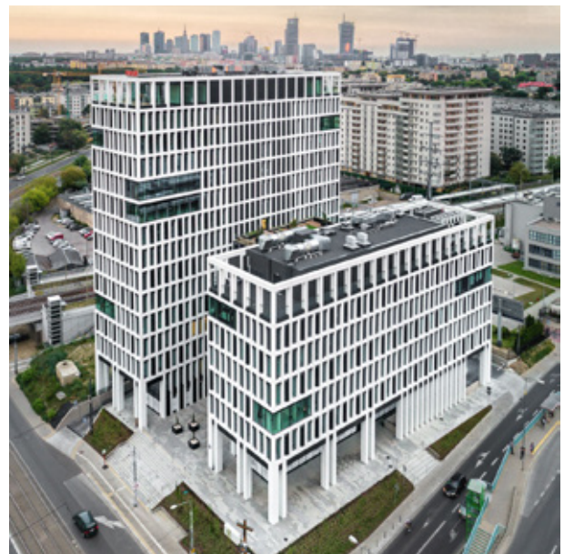
BIUROWIEC: VECTOR+ (WOLA) 2019