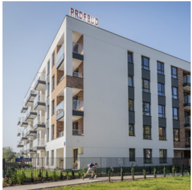
OSIEDLE: LIGIA I ETAP (URSUS) 2020