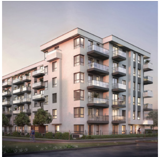
OSIEDLE: LIGIA II ETAP (URSUS) 2021