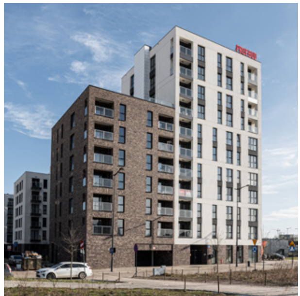
OSIEDLE: PRIMO I, II ETAP (ŁÓDŹ) 2020