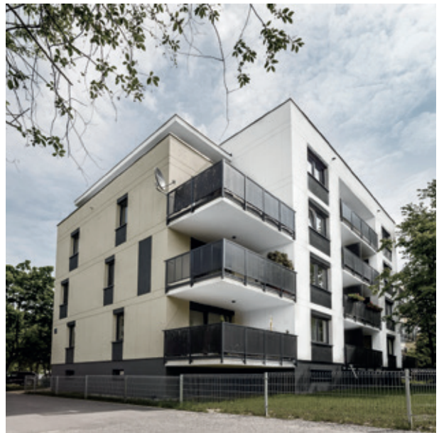
OSIEDLE: VENA (ŁOMIANKI) 2014