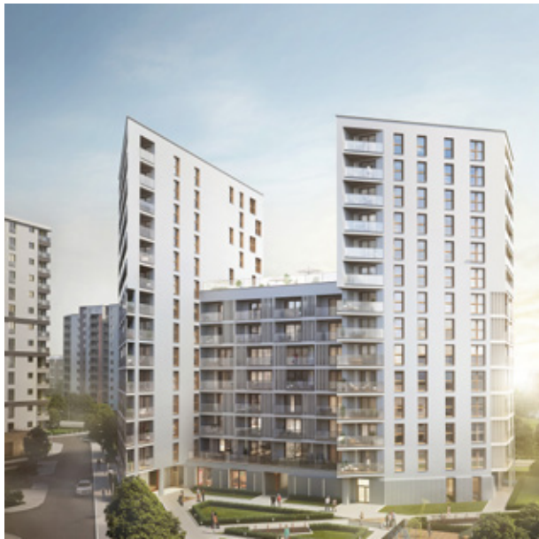
OSIEDLE: YUGO (GOCLAW) 2021