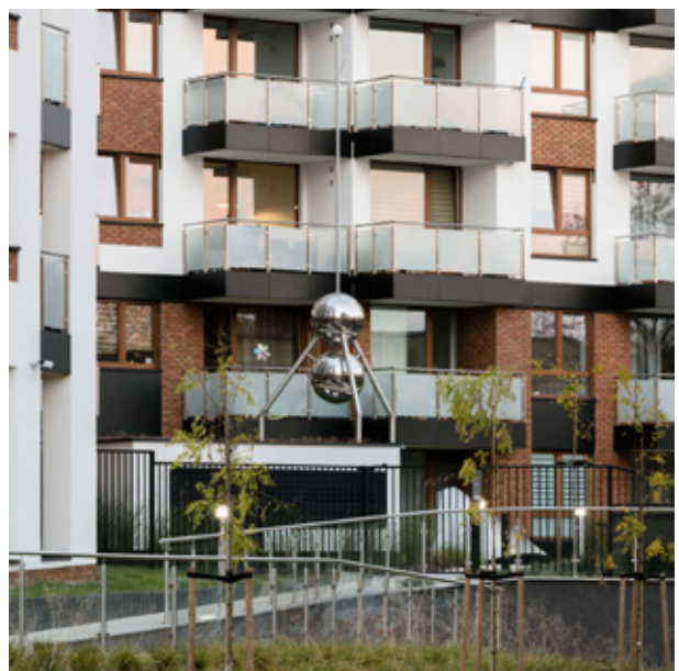
OSIEDLE: KWADRY KSIĘŻYCOWEJ (BIELANY) 2016