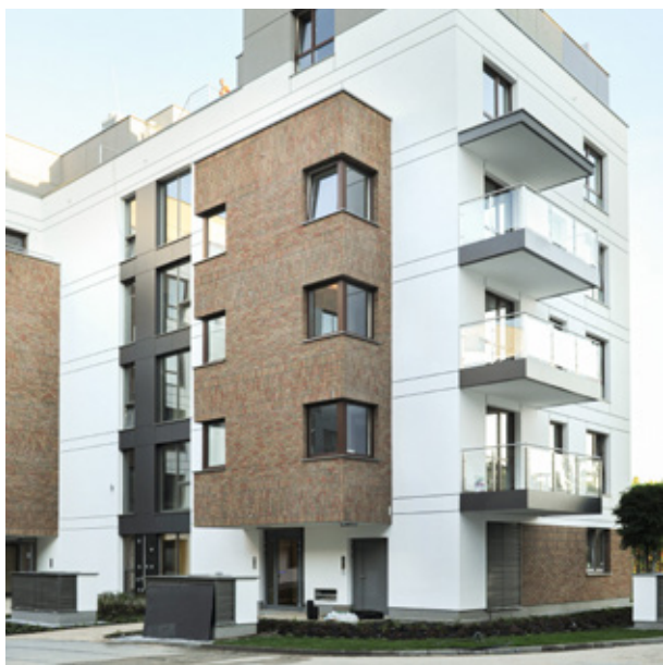
OSIEDLE: ESKADRA (BEMOWO) 2014