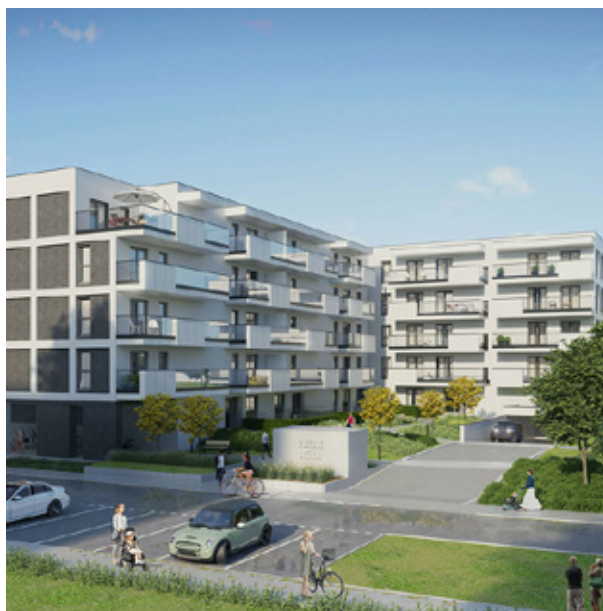
OSIEDLE: OSIEDLE STELLA IV ETAP (BEMOWO) 2021