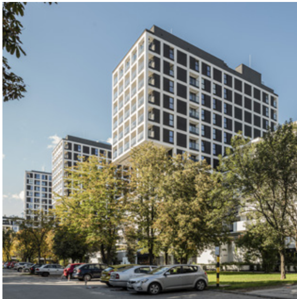
OSIEDLE: STELLA I, II, III ETAP (BEMOWO) 2020