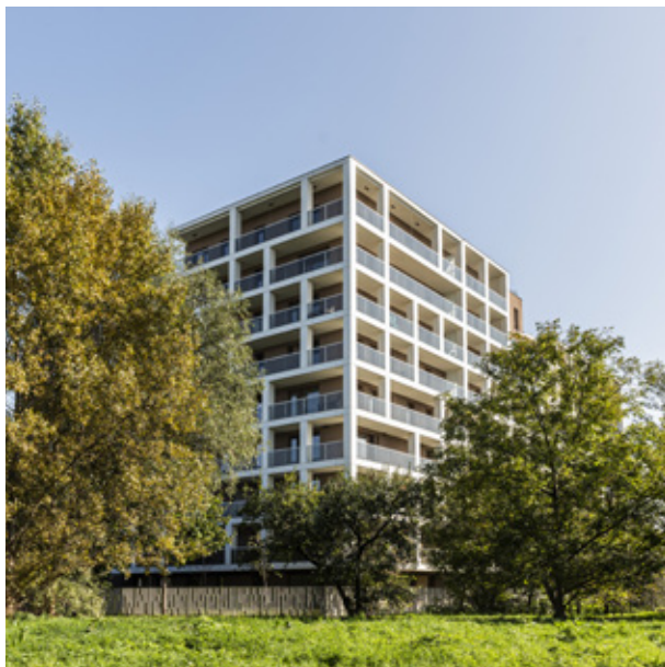
OSIEDLE: HAVEN HOUSE (PRAGA POŁUDNIE) 2020