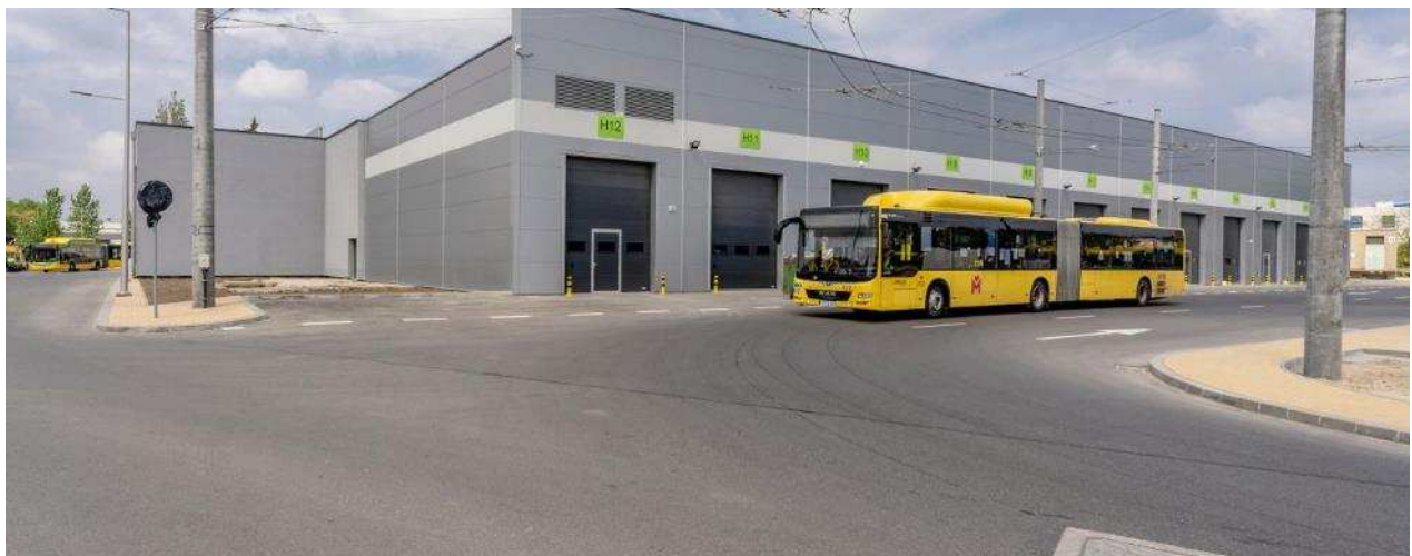
Zajezdnia autobusowa w Tychach