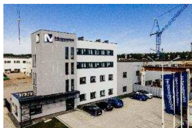
Siedziba Mostostal Kielce S.A.