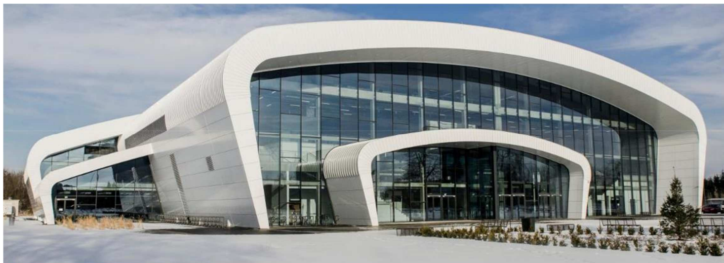
Hala widowiskowo-sportowa w Puławach