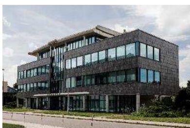
Siedziba AMK Kraków S.A.