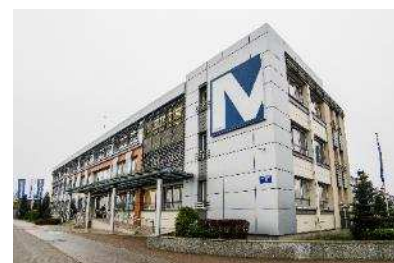
Siedziba Mostostal Płock S.A.

Mostostal Warszawa S.A. wchodzi w skład grupy kapitałowej Acciona S.A. z siedzibą w Madrycie. Acciona Construcción S.A. jest właścicielem 62,13 % akcji Mostostalu Warszawa S.A. wg stanu na 30.06.2021 r.