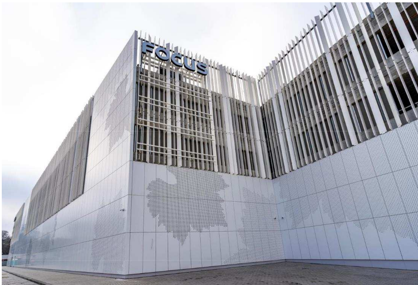
Galeria Handlowa Focus Mall w Zielonej Górze

W ocenie Zarządu nie występują inne informacje istotne dla oceny sytuacji Spółki, niż wymienione w pozostałych punktach półrocznego sprawozdania z działalności za I półrocze 2021 r. oraz w dodatkowych informacjach i objaśnieniach do skróconego śródrocznego sprawozdania finansowego za okres 01.01.2021 roku – 30.06.2021 roku.