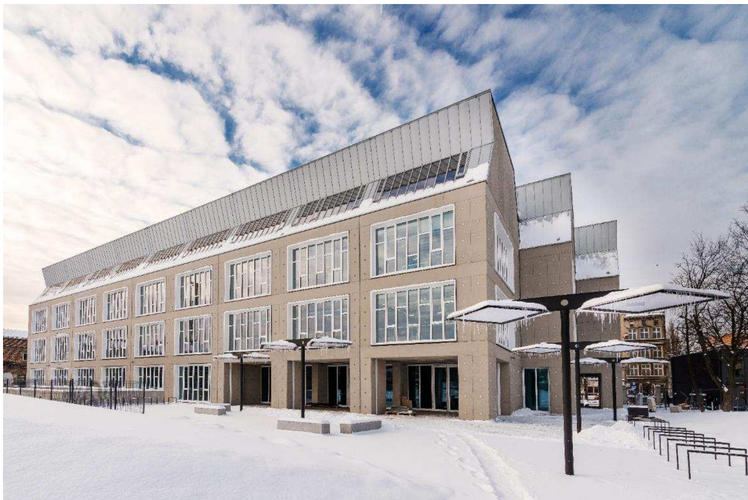
Biurowiec LPP Fashion Lab w Gdańsku

W dniu 22 lipca 2021 r. zostały przekazane szacunkowe wyniki za I półrocze 2021 r.