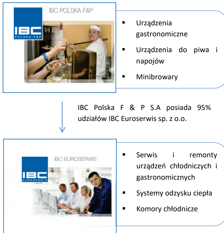
Tabela: Wykaz jednostek wchodzących w skład Grupy Kapitałowej IBC POLSKA F & P S.A.