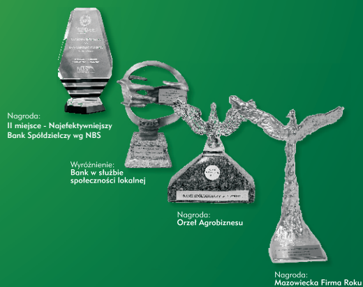
Nagroda: II miejsce - Najefektywniejszy Bank Spółdzielczy wg NBS