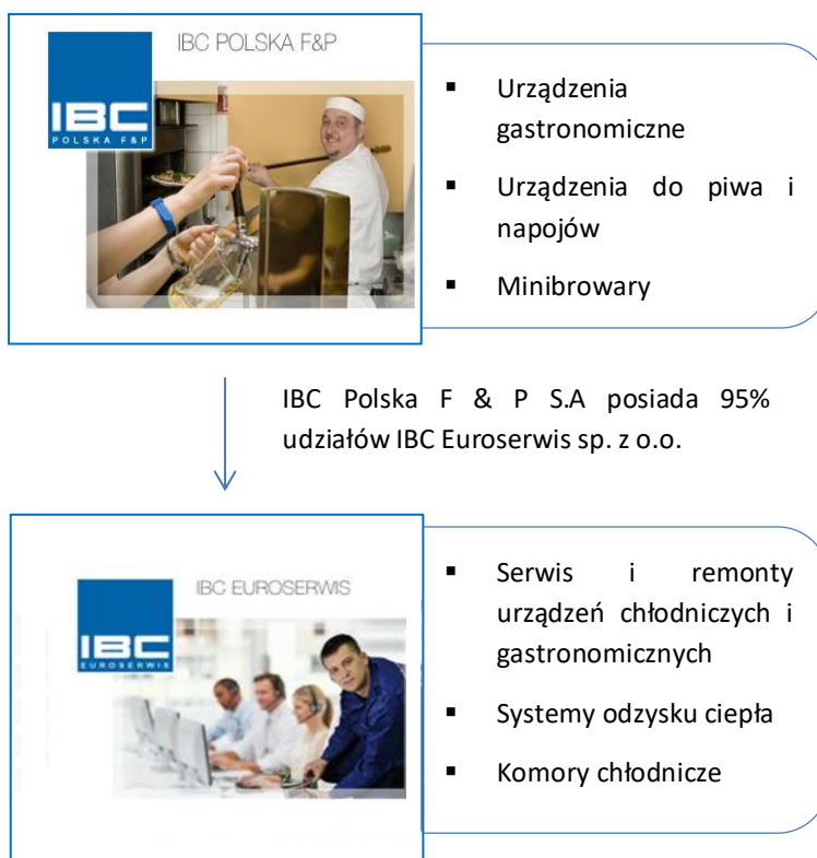
Tabela: Wykaz jednostek wchodzących w skład Grupy Kapitałowej IBC POLSKA F & P S.A.