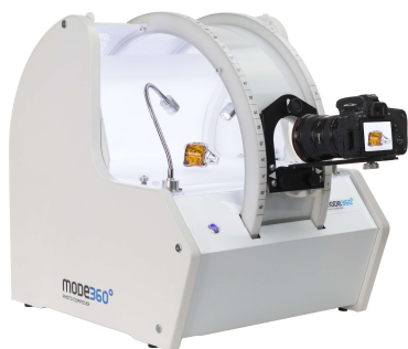
Photo Composer to kompaktowe urządzenie posiadające własne oświetlenie fotograficzne LED, stół bezcieniowy z platformą obrotową do zdjęć 360 stopni oraz ramię do zdjęć sferycznych 3D.

Oferta MODE SA zorientowana jest na rozwiązania do fotografii produktowej, wizualizacji cyfrowej oraz narzędzi do prac konserwatorskich przy ochronie zabytków oraz dla rynku medycznego i kosmetycznego.