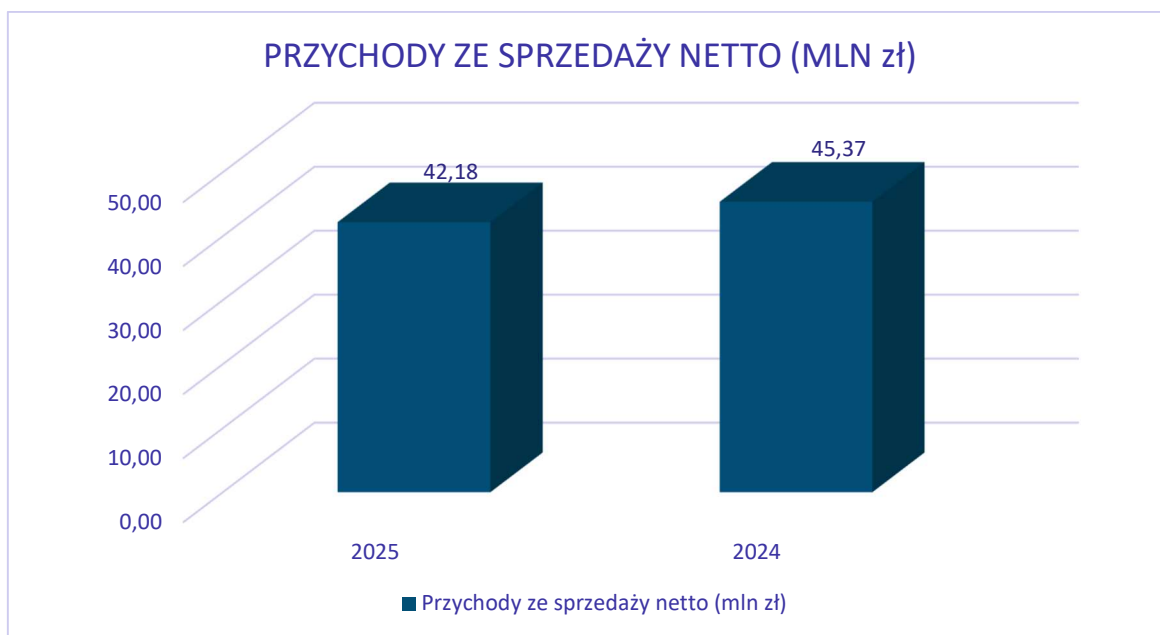
Wykres nr 1: Porównanie przychodów Prymus S.A. w latach 2025 i 2024.