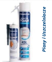
Piany i Uszczelniacze