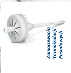
Zamocowania Termoizolacji Fasadowych