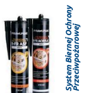
System Biernej Ochrony Przeciwpożarowej