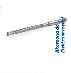
Akcesoria do Elektronarzędzi