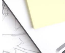
Zszywacz Pistolety do Kleju Akcesoria