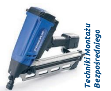
Techniki Montażu Bezpośredniego