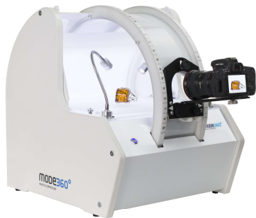
Photo Composer to kompaktowe urządzenie posiadające własne oświetlenie fotograficzne LED, stół bezcieniowy z platformą obrotową do zdjęć 360 stopni oraz ramię do zdjęć sferycznych 3D.