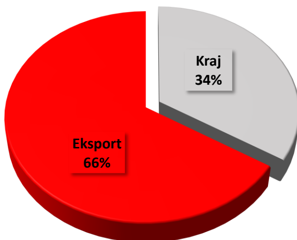
Geograficzna struktura sprzedaży ZMR S.A. w I półroczu 2023r.

Struktura sprzedaży zaprezentowana na powyższym wykresie została przygotowana w ujęciu zarządczym i opiera się na geograficznym podziale ostatecznych konsumentów materiałów ogniotrwałych ZMR S.A.