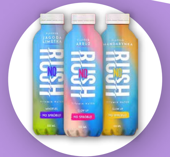
Woda witaminowa noRush - pierwszy produkt spółki ESSA