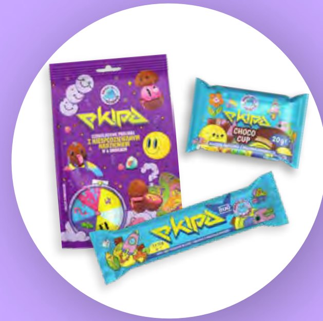
Czekoladowe Choco Cup'y, Batoniki i challenge-owe praliny o sześciu smakach z firmą Milano