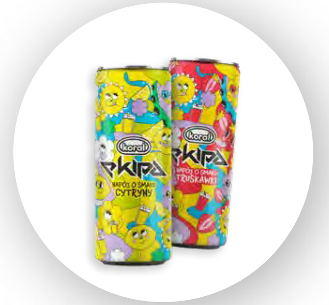
2 smaki napojów z firmą Koral