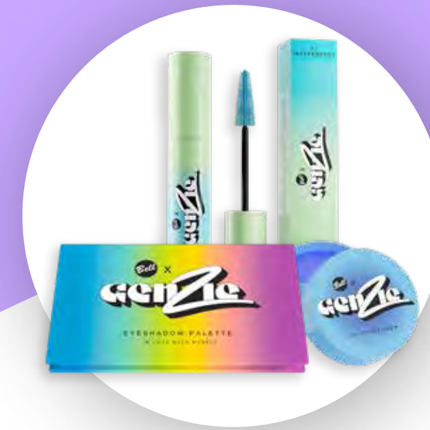
Zestaw kosmetyków do makijażu GenZie z firmą Bell