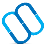
Wide Medical Solution

Data Center, usługi hostingowe i kolokacji serwerów – usługi obejmujące wynajem określonych zasobów hostingowych zarządzanych programowo, wynajem serwerów wraz ze wsparciem serwisowym oraz wynajem infrastruktury. W ostatnich latach COIG S.A. stworzyło profesjonalne Data Center, które stało się podstawą do świadczenia usług outsourcingowych dla największych polskich firm. Potężną moc obliczeniową Data Center zapewniają najnowocześniejsze, wieloprocessorowe serwery pracujące w trybie wysokiej niezawodności, wykorzystywane jako podstawa środowisk wirtualizacyjnych oraz macierze dyskowe zapewniające wydajną i niezawodną przestrzeń na dane Klientów.