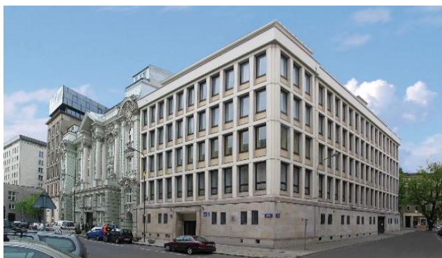
Oddział WASKO S.A. Warszawa, ul. Czackiego

Posiadamy m.in. certyfikat ISO 9001, ISO 14001, ISO 27001. Nasze kompetencje umożliwiają realizację ogólnopolskich systemów mających na celu poprawę bezpieczeństwa i obronności kraju.