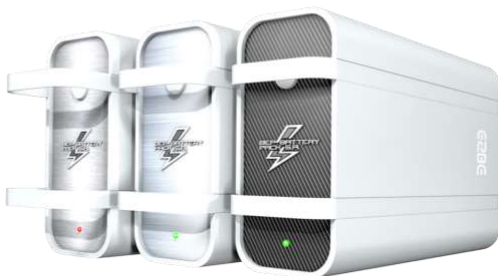
Baterie litowe