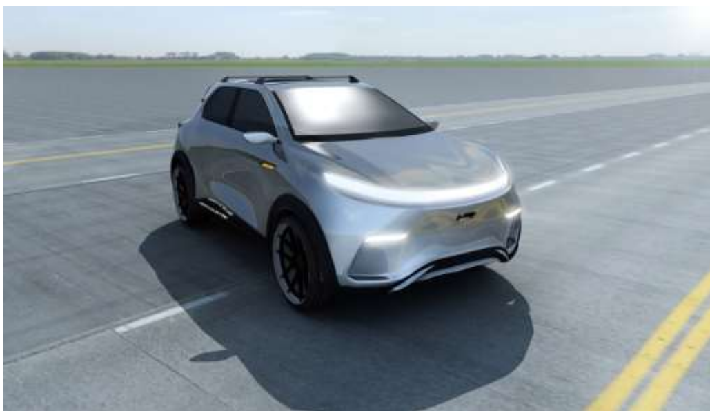
Źródło własne - Biomass Energy Project S.A. . Projekt SUV-a z napędem elektrycznym