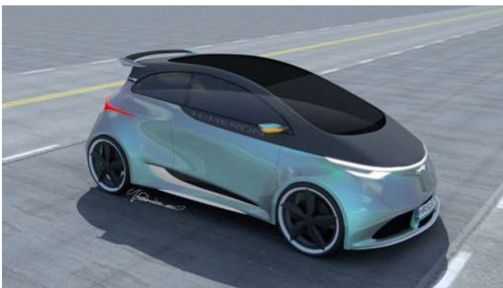
Źródło własne - Biomass Energy Project S.A. . Projekt samochodu osobowego z napędem elektrycznym dla Heron Electric S.