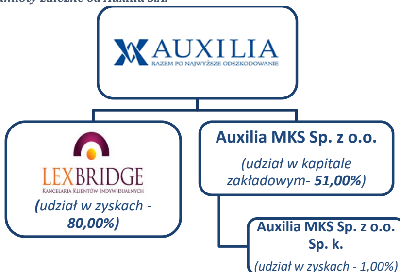
Schemat 1 Podmioty zależne od Auxilia S.A.

Na dzień sporządzenia Dokumentu Informacyjnego Emitent jest podmiotem bezpośrednio dominującym w stosunku do Lexbridge Groński Adwokaci i Radcowie Prawni sp. k. z siedzibą we Wrocławiu oraz Auxilia MKS sp. z o.o. z siedzibą we Wrocławiu. Auxilia MKS sp. z o.o. jest ponadto komplementariuszem Auxilia MKS sp. z o.o. sp. k.