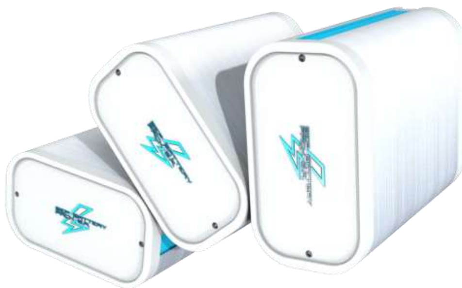
Źródło własne - Biomass Energy Project S.A. Systemy baterii litowych