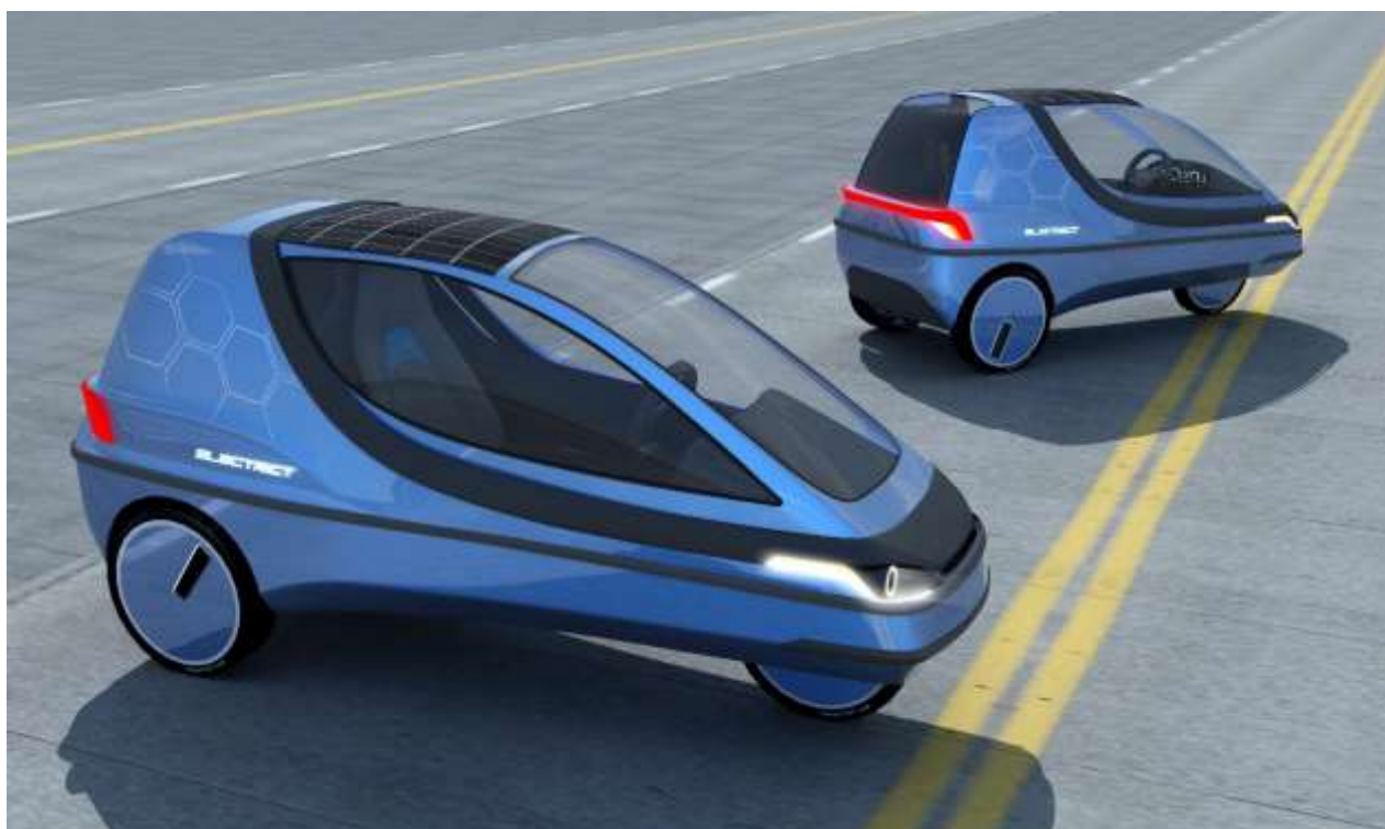
Projekt modernizacji trójkołowego pojazdu elektrycznego dla Hoverjet i Heron Electric