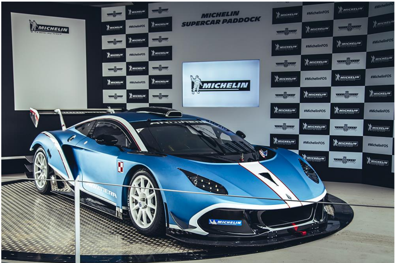
Arrinera Hussarya GT podczas prezentacji w Michelin Supercar Paddock