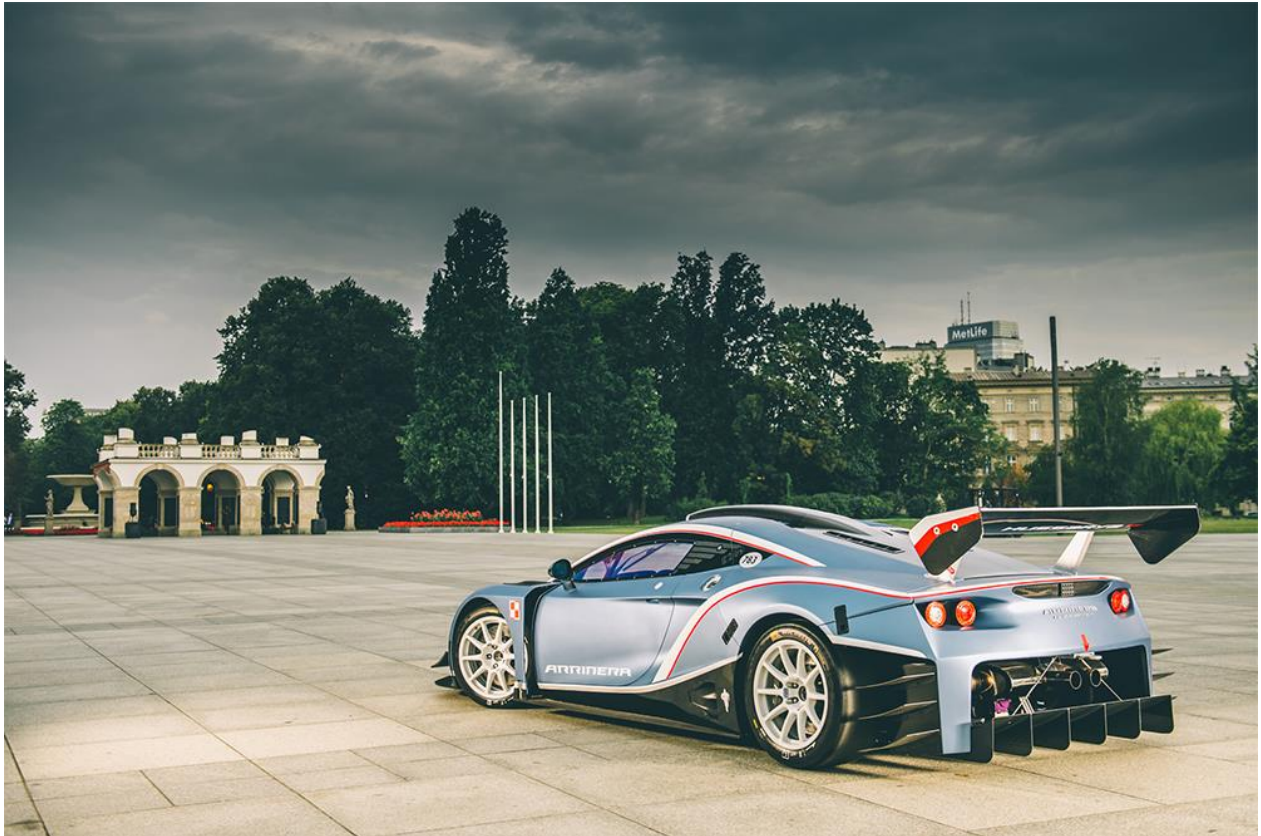
Warszawa – Plac Piłsudskiego

W Szczecinie Hussarya GT odwiedziła pokryte kostką tarasy Wałów Chrobrego, powstałych jako Tarasy Hakena. Ich zakręty i monumentalne budynki na szczycie zbocza górującego nad Odrą podkreśliły niezwykłość tej fotograficznej lokalizacji.