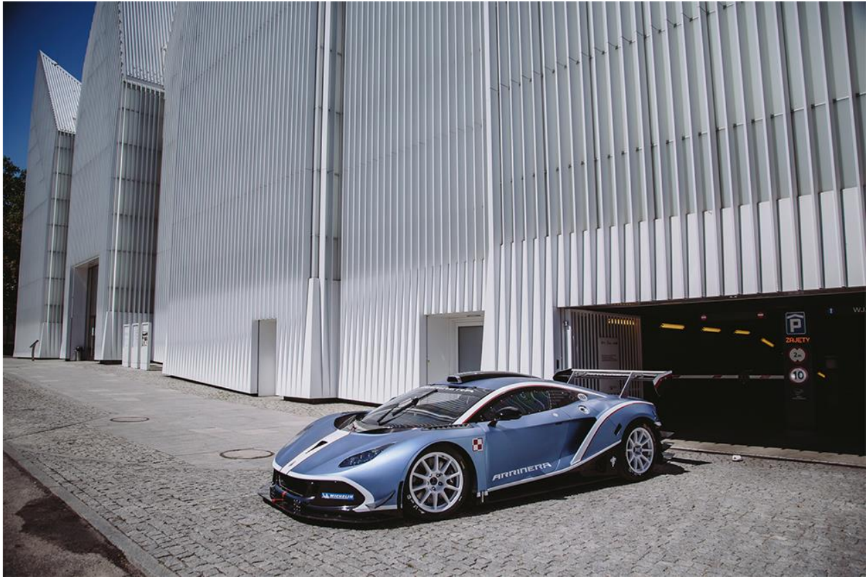
Szczecin – Filharmonia imienia Mieczysława Karłowicza

W Szczecinie nasz samochód pojawił się jeszcze przed Muzeum Techniki i Komunikacji, przed Filharmonią imienia Mieczysława Karłowicza, która w 2015 zdobyła tytuł najpiękniejszego budynku Europy, a także w głębi szczecińskiego portu oraz na bulwarze naprzeciw Starego Miasta.