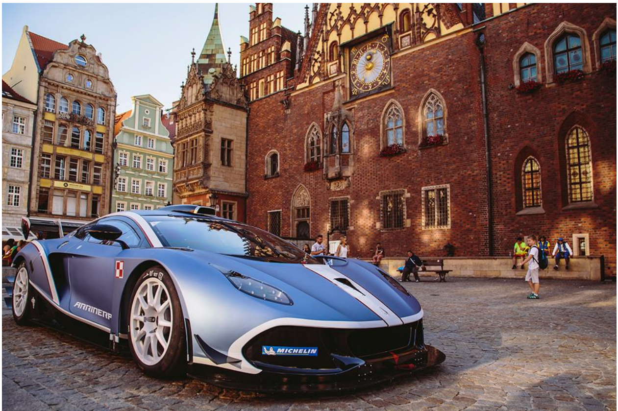
Wrocław – Rynek Starego Miasta

W Szczecinie nasz samochód pojawił się jeszcze przed Muzeum Techniki i Komunikacji, przed Filharmonią imienia Mieczysława Karłowicza, która w 2015 zdobyła tytuł najpiękniejszego budynku Europy, a także w głębi szczecińskiego portu oraz na bulwarze naprzeciw Starego Miasta.