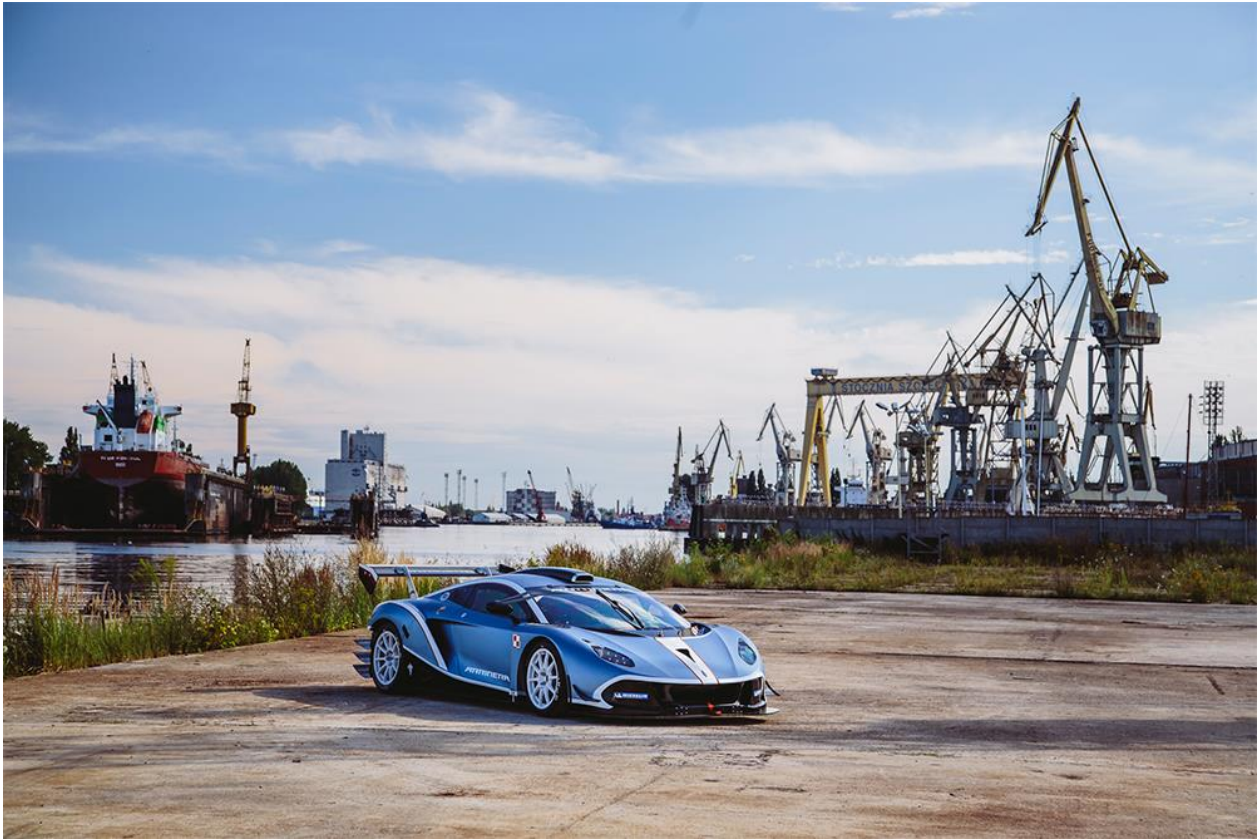
Szczecin – Stocznia

Później samochód znalazł się na Jasnych Błoniach, wśród najliczniejszych w Polsce platanów, a jego dopracowane aerodynamicznie nadwozie w niespodziewany sposób harmonizowało ze światłocieniami w słoneczny dzień.