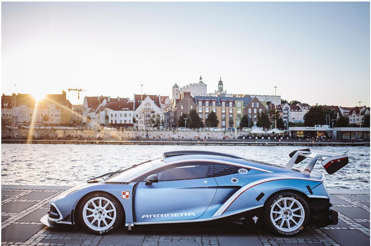
Szczecin – Bulwary nad Odrą

W Szczecinie Hussarya GT odwiedziła pokryte kostką tarasy Wałów Chrobrego, powstałych jako Tarasy Hakena. Ich zakręty i monumentalne budynki na szczycie zbocza górującego nad Odrą podkreśliły niezwykłość tej fotograficznej lokalizacji.