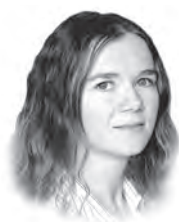
FOT. W. KOMPALA

Liczba audytorów badających sprawozdania spółek z GPW systematycznie spada. Czołówkę nadal tworzą firmy z grona tzw. wielkiej czwórki. Ale z coraz większymi sukcesami rywalizują z nimi także Grant Thornton, BDO, UHY ECA i PKF Consult.