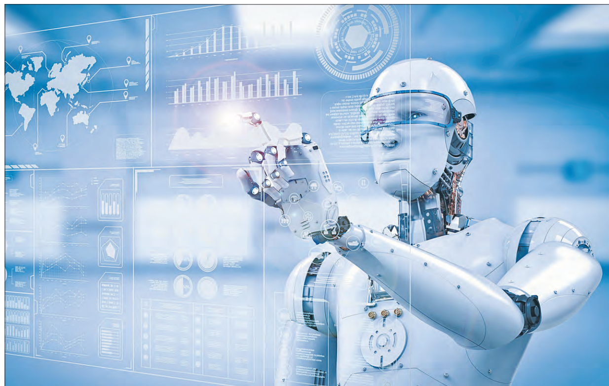
Sztuczna inteligencja jest wykorzystywana coraz częściej w procesie identyfikacji i oceny ryzyka, który jest jednym z najważniejszych etapów badania sprawozdania finansowego.

Sztuczna inteligencja pomoże audytorom skoncentrować się na transakcjach obciążonych wysokim ryzykiem oraz ograniczyć liczbę powtarzalnych czynności i procedur do minimum.