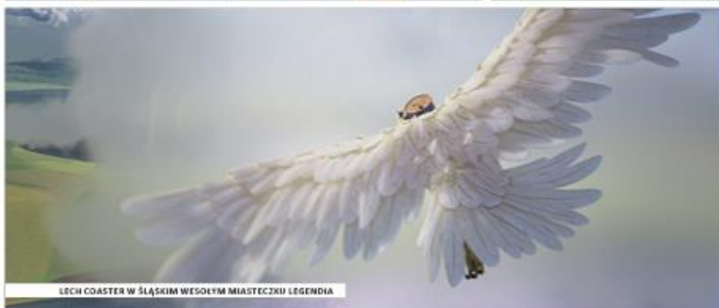
LECH COASTER W ŚLĄSKIM WESOŁYM MIASTECZKU LEGENDIA