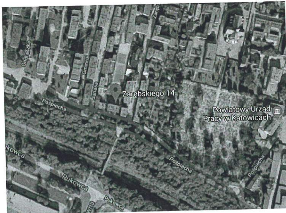
Rysunek: Lokalizacja przedmiotu wyceny