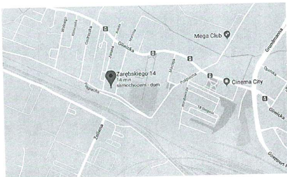
Rysunek: Lokalizacja przedmiotu wyceny

Występujące czynniki środowiskowe, stan usług i zaplecza bytowego można uznać za odpowiednie dla tego typu zabudowy.