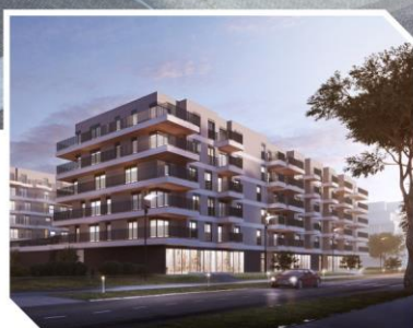
ATAL Marina III, Warszawa