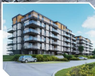
Pomorska Park, Łódź