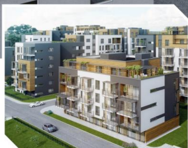
ATAL Francuska Park III, Katowice