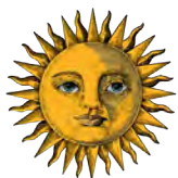
Foto Volt Eko Sp. z o.o. Sp.kom. powstała w lipcu 2019 r. i koniec I kw. 2020 r. wykonała kilkadziesiąt instalacji fotowoltaicznych na rynku śląskim o mocach jednostkowych od 4 kWp do kilkudziesięciu kWp. Atutem FVE są pracownicy posiadający ponad 20-letnie doświadczenie w pracach elektrycznych na wysokościach oraz uprawnienia elektryczne i certyfikaty Urzędu Dozoru Technicznej w zakresie Odnawialnych Źródeł Energii. FVE zakończyła rok 2019 zyskiem netto w wys. 42.994,85 zł i kontynuowała działalność w I kw. br na podobnym poziomie rentowności biznesu jak w 2019 r.

Emitent przejął operacyjną działalność spółki zależnej w II kw. 2020 r.