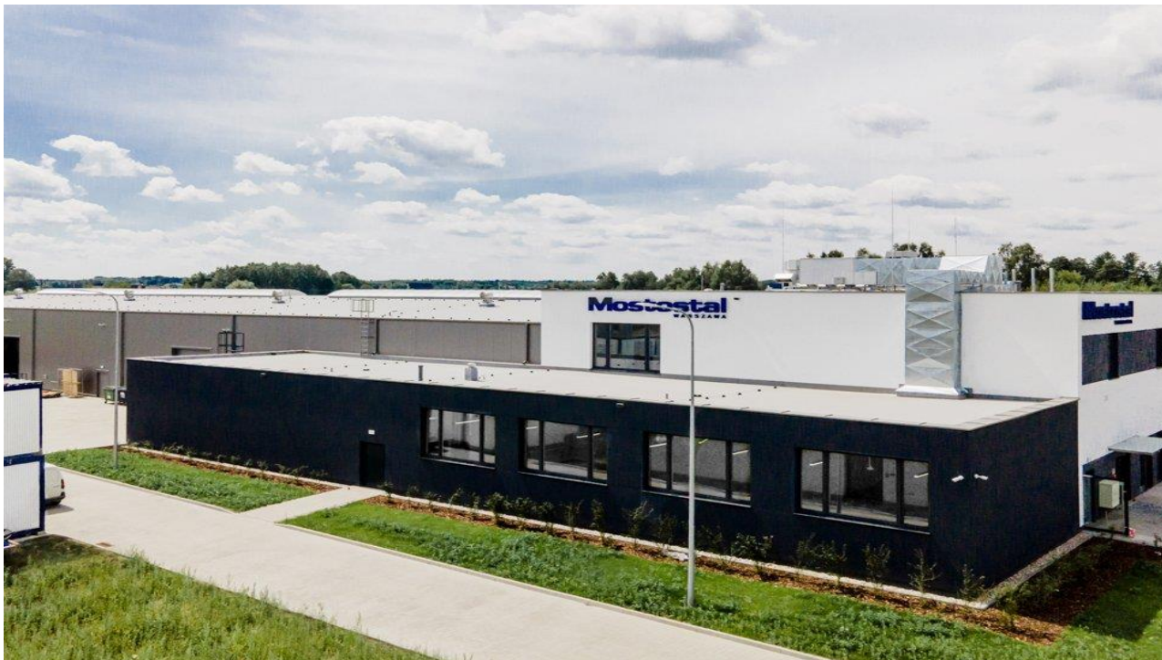
Baza Sprzętowo Transportowa firmy Mostostalu Warszawa w Urzucie