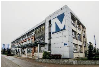
Siedziba Mostostal Płock S.A.