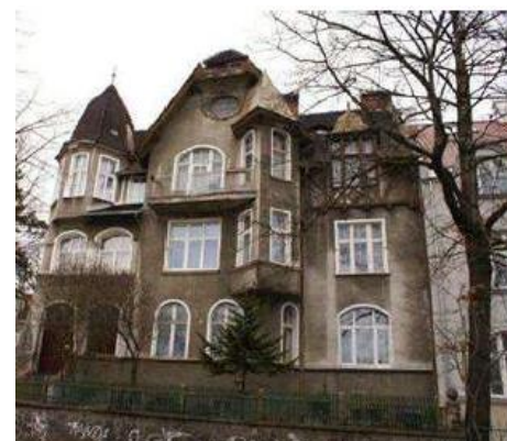
Sopot, ul. Chopina 7. Stan przed i po restrukturyzacji