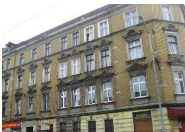
Gliwice, ul. Św. Katarzyny 1. Stan przed i po rewitalizacji