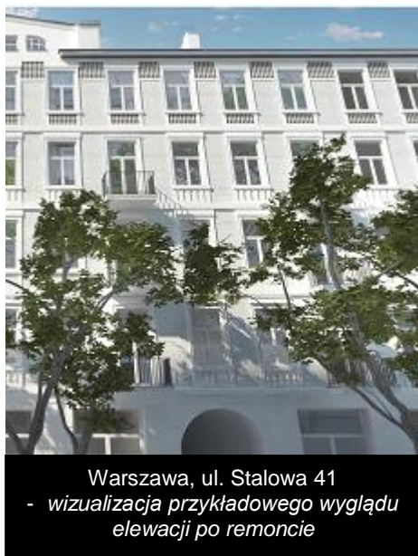
Warszawa, ul. Stalowa 41 - wizualizacja przykładowego wyglądu elewacji po remoncie