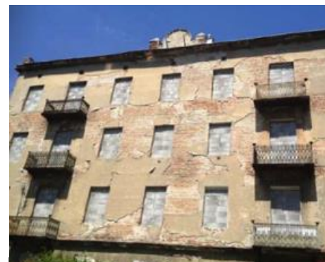
Warszawa, ul. Kamionkowska 41. Stan przed i po restrukturyzacji

Zgodnie z informacjami posiadanymi przez Emitenta, na dzień przekazania raportu akcjonariuszami posiadającymi co najmniej 5% głosów na walnym zgromadzeniu akcjonariuszy 2C Partners są następujące podmioty: