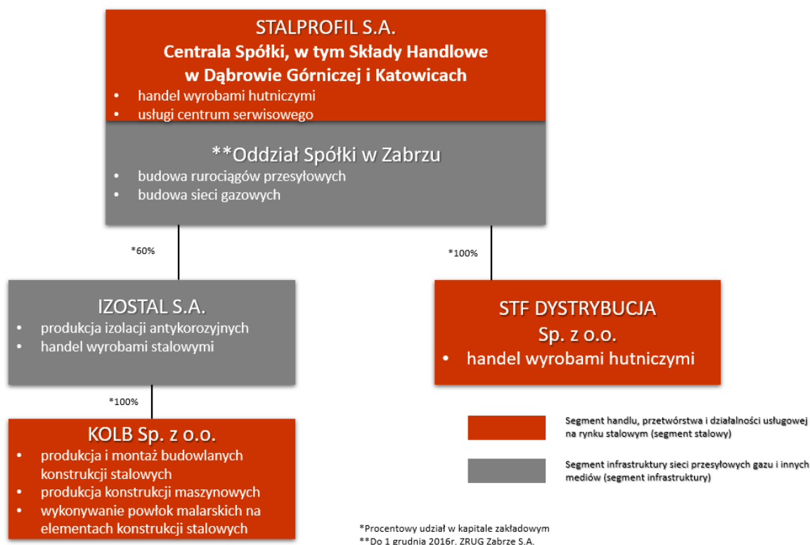
Rysunek 1 Struktura Grupy Kapitałowej STALPROFIL S.A.

Poziom zatrudnienia w Grupie Kapitałowej STALPROFIL S.A. na koniec III kw. 2022 r. oraz jego strukturę według charakteru wykonywanej pracy przedstawia Tabela nr 4. Stan zatrudnienia w Grupie na dzień 30 września 2022 wynosił 557 osób i wzrósł o 3% r/r.