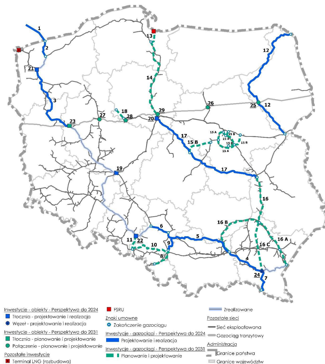
Rysunek 4 Inwestycje strategiczne planowane w latach 2022-2031 (źródło: Krajowy Dziesięcioletni Plan Rozwoju 2022-2031 – wyciąg)

Gaz-System S.A. zapowiada ponadto, iż po zakończeniu kluczowych inwestycji infrastrukturalnych na znaczeniu zyskiwać będą zadania remontowo-modernizacyjne, co również zapewni Grupie rynek zbytu oferowanych produktów. Wysoką rangę i wzrost tempa realizowanych w Polsce inwestycji w