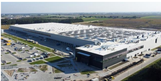
LPP BRZEŚĆ KUJAWSKI