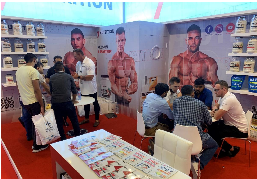
Zdjęcie 1 Stoisko 7FIT S.A. na targach Dubai Muscle Show

W IV kw. 2021 r. (28-30 października 2021 r.) Zarząd Emitenta brał udział jako wystawca w targach Dubai Muscle Show. Jest to największe wydarzenie branży fitness i kulturystyki w rejonie Bliskiego Wschodu. Koszty udziału w targach wyniosły ok. 150 tys. zł i obniżyły wynik za IV kw. 2021 r., niemniej jednak Zarząd szacuje, iż podjęte rozmowy z kontrahentami pomogą przyczynić się do rozwoju eksportu produktów Emitenta.