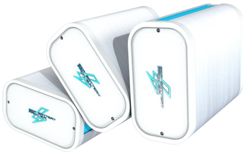
Systemy baterii litowych