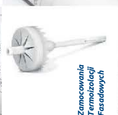
Zamocowania Termoizolacji Fasadowych