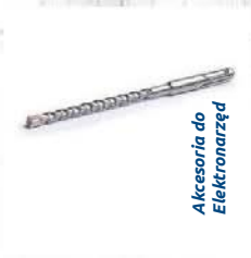
Akcesoria do Elektronarzęd