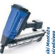
Techniki Montażu Bezpośredniego