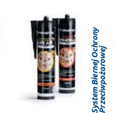
System Biernej Ochrony Przeciwpożarowej