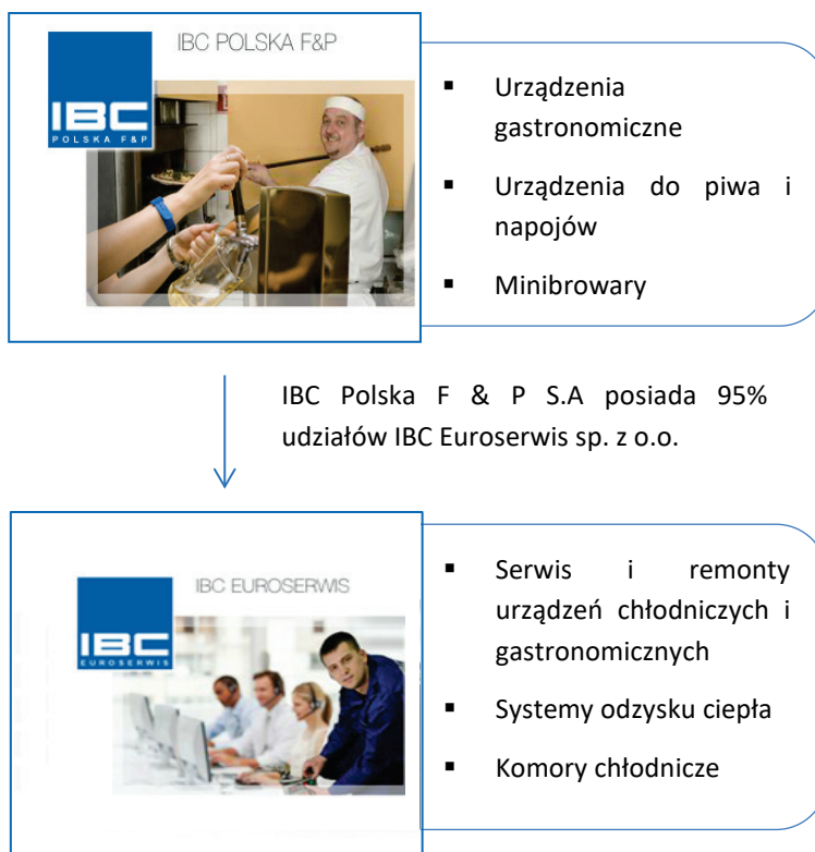
Tabela: Wykaz jednostek wchodzących w skład Grupy Kapitałowej IBC POLSKA F & P S.A.