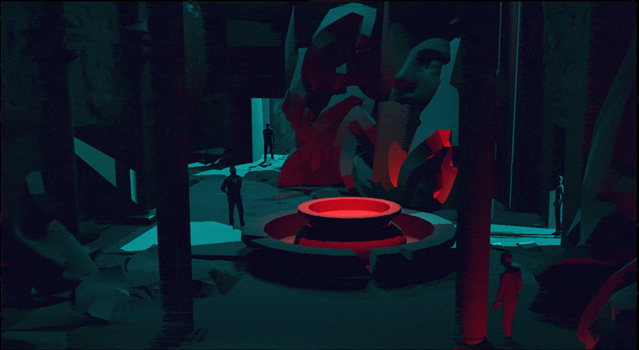
Halls of Horror