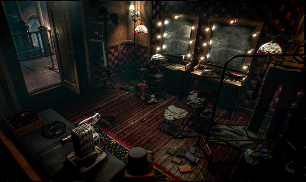
Layers of Fear 2