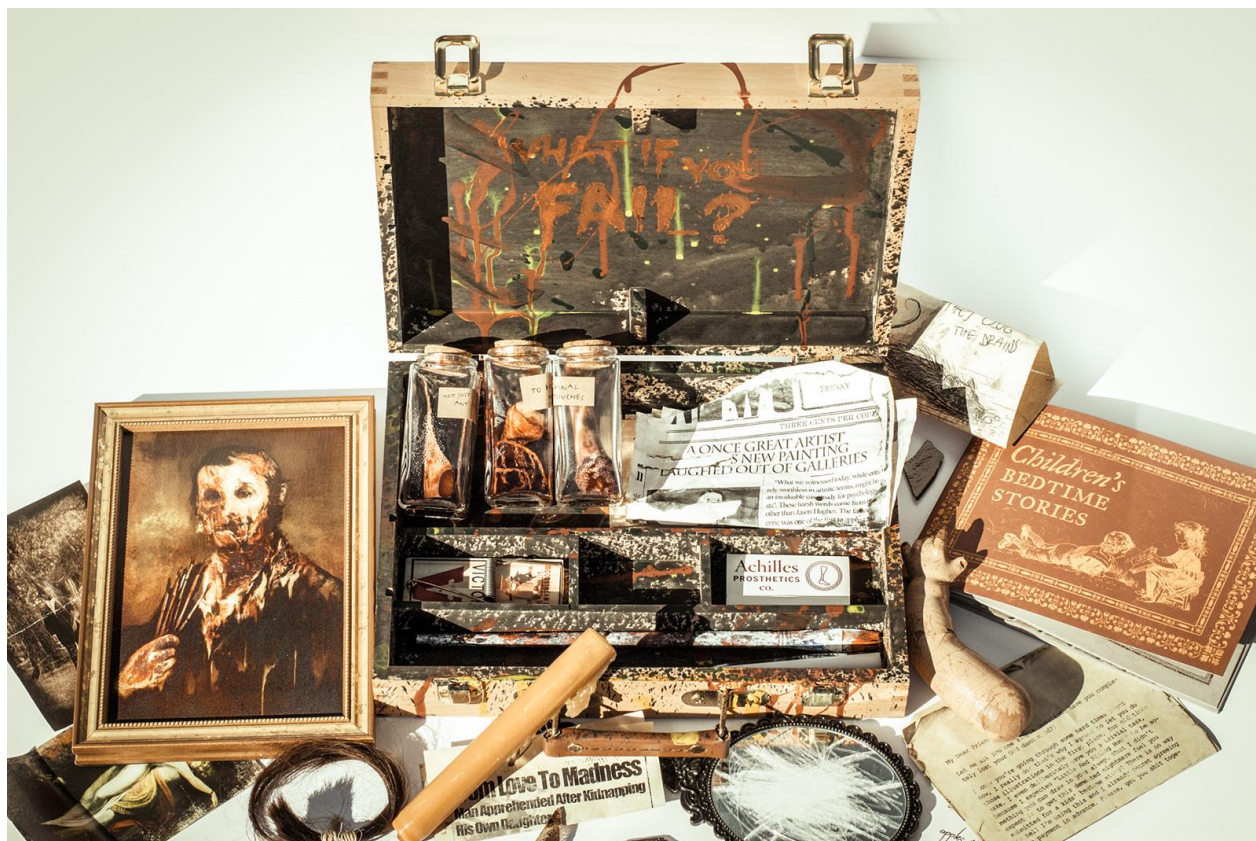
Pakiet promocyjny gry "Layers of Fear"