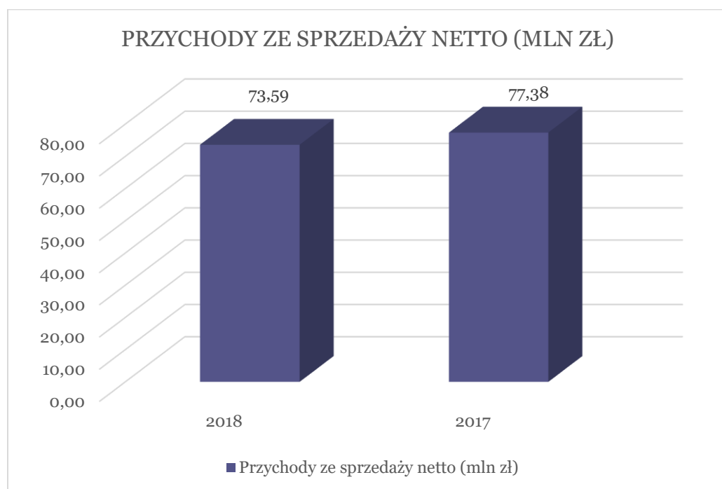
Wykres nr 1: Porównanie przychodów Prymus S.A. w latach 2018 i 2017.

Rentowność sprzedaży netto wyniosła 5,8%.