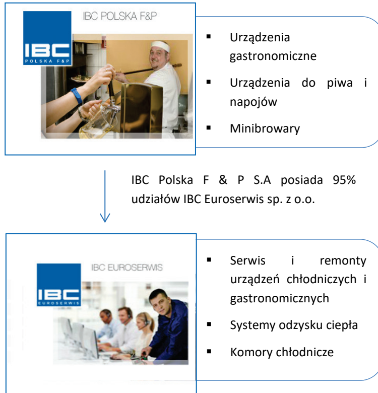
Tabela: Wykaz jednostek wchodzących w skład Grupy Kapitałowej IBC POLSKA F & P S.A.