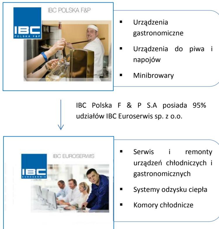
Tabela: Wykaz jednostek wchodzących w skład Grupy Kapitałowej IBC POLSKA F & P S.A.