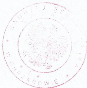
Andrzej Sebastyanka Notariusz w Chrzanowie